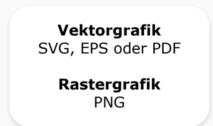
Dateiformat Die Schriftart muss eingebettet sein!